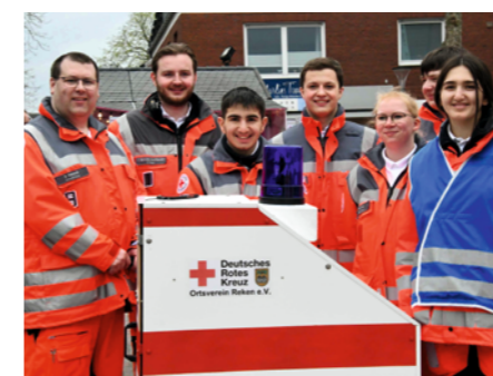
3. Platz: Rotkreuzgemeinschaft des DRK-Ortsvereins Reken

Zum Leistungsvergleich sind Teams der Ortsvereine Ahaus, Gescher, Isselburg, Nienborg-Heek, Reken und Stadtlohn angetreten. Alle Teams waren sehr motiviert und haben ihr Können und ihren Ausbildungsstand gezeigt. In den Wettbewerben werden tatsächliche Einsätze trainiert, daher nehmen die ehrenamtlichen Helferinnen und Helfer viel Erfahrung mit, vor allem für die Teamarbeit. Die Rotkreuzgemeinschaft des DRK-Ortsvereins Gescher und die Rotkreuzgemeinschaft des DRK-Ortsvereins Isselburg haben den Kreiswettbewerb 2023 gewonnen, dritter wurde die Rotkreuzgemeinschaft des DRK-Ortsvereins Reken.