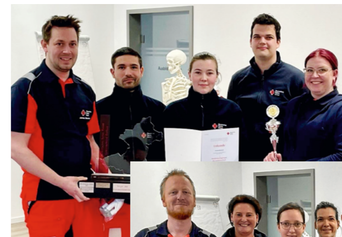
oben: Rotkreuzgemeinschaft des DRK-Ortsvereins Gescher, unten: Rotkreuzgemeinschaft des DRK-Ortsvereins Isselburg

Die Coronapandemie hatte zu einer dreijährigen Wettkampfpause gezwungen. Dieses Jahr konnte der Kreiswettbewerb in Stadtlohn am verkaufsoffenen Frühlingstag in der vollen Innenstadt endlich wieder stattfinden. Der Kreiswettbewerb dient vor allem dazu, Erkenntnisse über den Ausbildungsstand der ehrenamtlichen Helferinnen und Helfer zu erhalten. Bis zu drei Siegergruppen können am DRK-Landeswettbewerb teilnehmen.